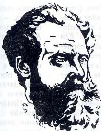
ANTERO DE QUENTAL

E aqui está como se chega a averiguar que António Arroio se enganou e tem enganado os biógrafos de Antero: o ano em que o poeta foi examinador no Liceu Nacional do Porto foi, não o de 1870, mas sim o de 1872.