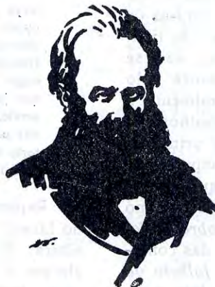
ANTERO DE QUENTAL