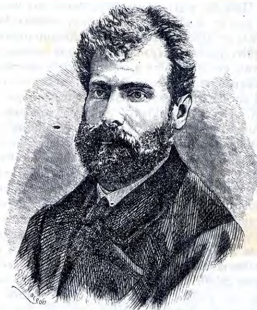
ANTERO DE QUENTAL (1842-1891)