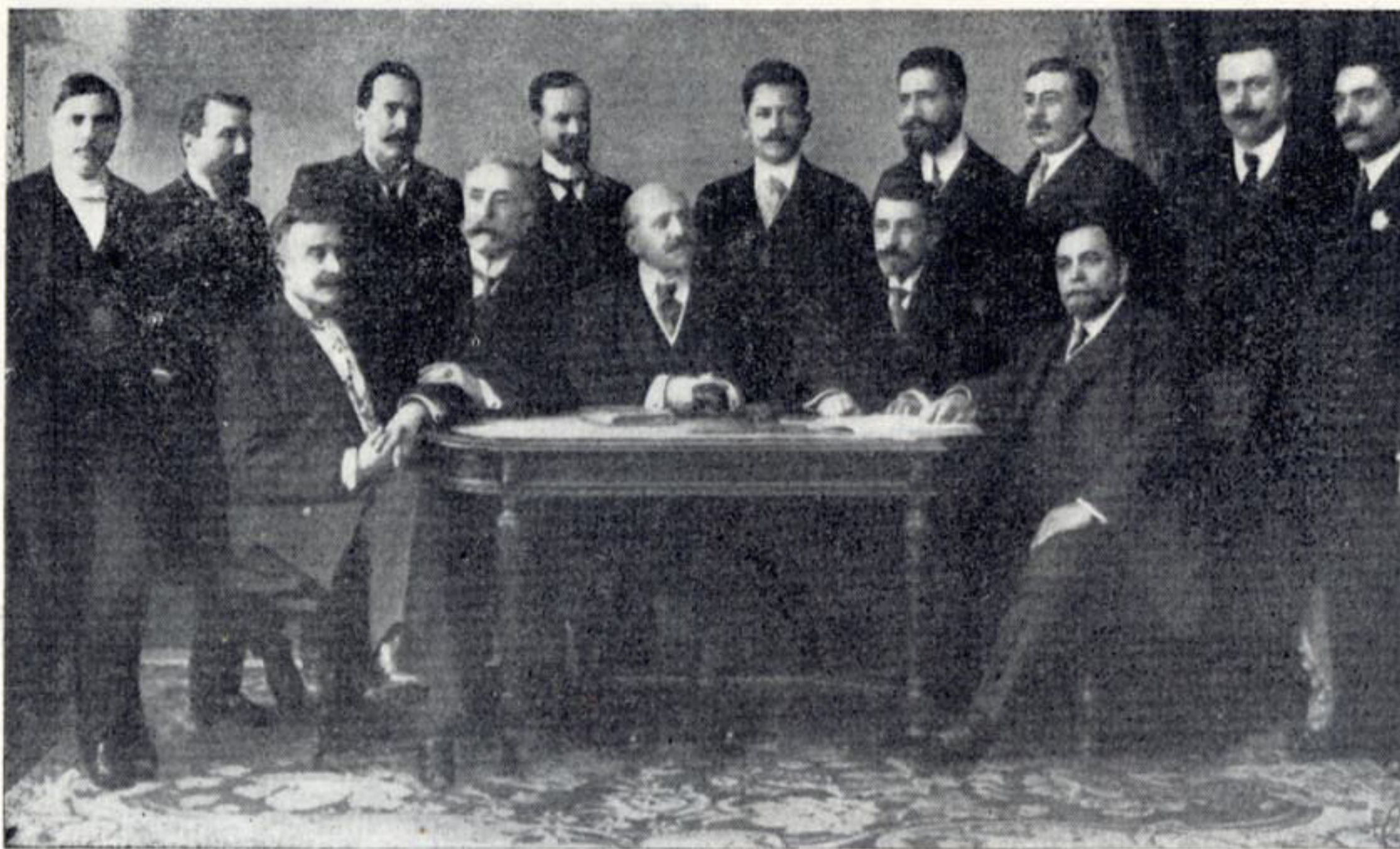
Comissão executiva do 1.º Congresso Nacional de Deontologia e Interesses Profissionais (Fevereiro de 1912)